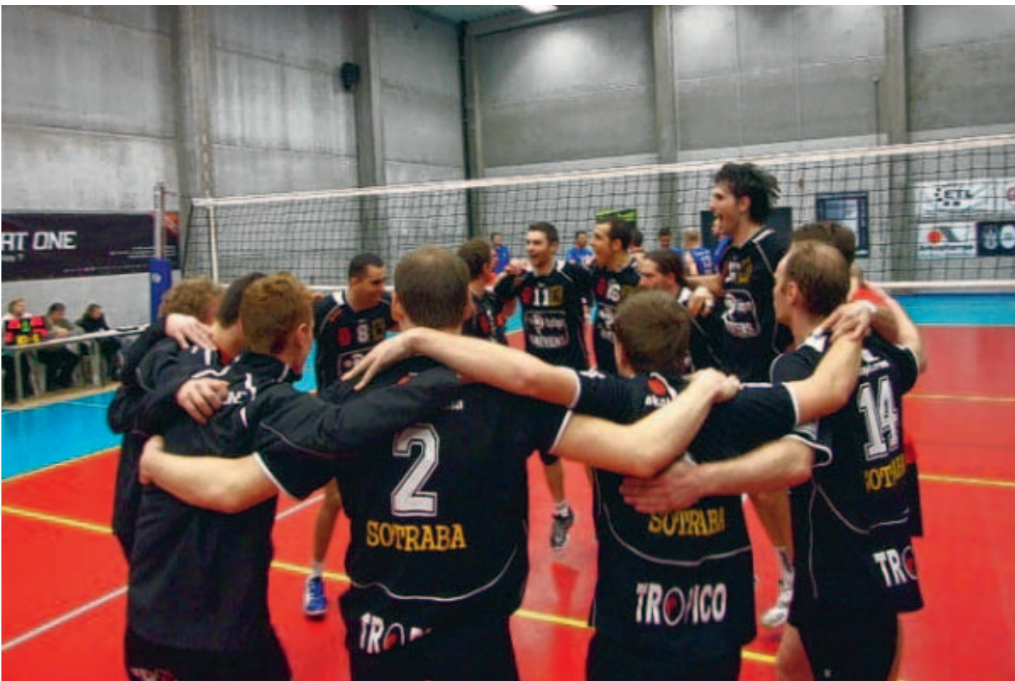
vt. Les Nivellois vont devoir rester soudés pour ces trois derniers matchs s'ils veulent se maintenir.

« ON PEUT PARLER D'UN OFF-DAY TOTAL POUR LE BW NIVELLES DIMANCHE »