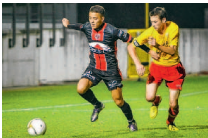
Bruxellois et Tubiziens croiseront le fer le mercredi 3 avril à 20h30. ■ L.D.

Deux nouvelles plutôt importantes sont tombées hier du côté de l'AFC Tubize. La première, c'est que le club devrait avoir la confirmation mercredi que tout est en ordre niveau licence. La seconde, c'est que le match contre le Brussels sera joué le 3 avril à 20h30 au Stade Machtens. Hier dans l'après-midi, Guy Brison était mis au courant que le dossier licence Sang et Or était clos. « Tout est en ordre et c'est un soulagement. Nous ne devons pas nous présenter le 27 mars à la Commission des licences pour nous laisser entendre dire qu'il manque des documents. Ce n'est